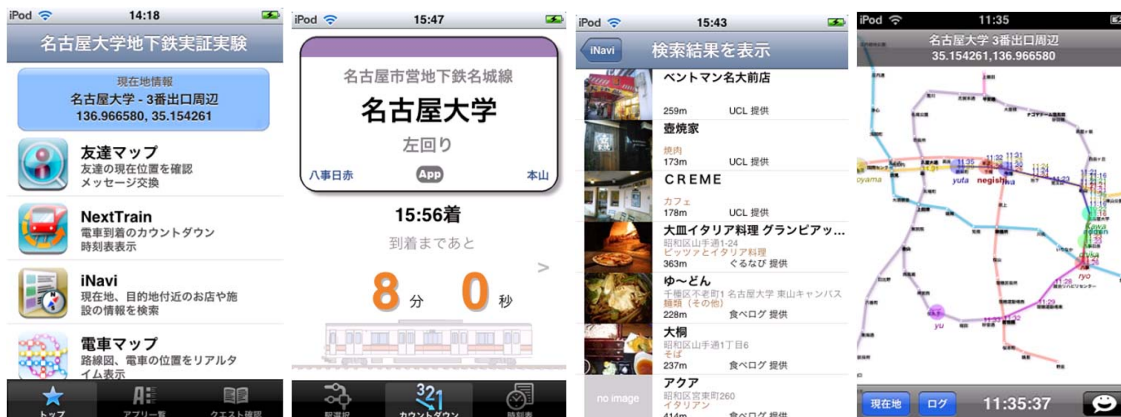
図2 ランチャー (左), 時刻表 (中央左), データベース (中央右), 友達マップ (右)