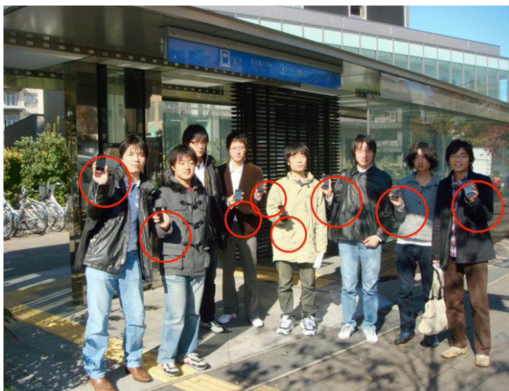
図3 実験に参加した被験者

被験者には、無線 LAN 位置推定機能を持つ小型携帯端末 (Apple iPod Touch) を課題とともに貸与する。課題には、目的や行先が示された上で、食事や用事などの付加的な課題も含まれている。被験者は地下鉄に乗り、端末上の様々な位置依存情報ソフトウェアを活用しながら課題をこなすことが指示されている。小型携帯端末上には、名古屋市営地下鉄の構内図をはじめ、路線図、時刻表、周辺位置依存情報データベースなどのアプリケーションが搭載され、現在の位置推定情報に基づいて適切な情報を提示する。また、友達探しのアプリケーションでは、無線 LAN を通じて地下鉄駅からチャットを楽しみながら、互いの位置を確認することができる。これらの実証実験結果は、ユーザの利用ログとして保存され、今後の位置依存情報活用を行うための基礎データとして活用する。