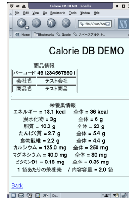
図 6: カロリー DB 情報取得画面

XIRD を使用することの利点の一つとして、Web アプリケーション以外にもさまざまなクライアントを容易に実装可能という点があげられる。カロリー DB に対するもう一つのサンプルクライアントとして、カロリーの値のみを取得し、値を csv ファイルに書き出すアプリケー